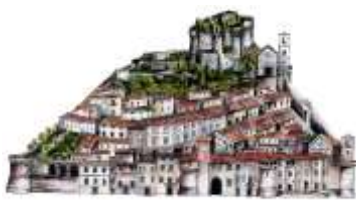
Pro Loco Castiglione